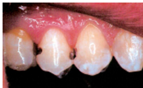
Figura 2. Estas preparaciones de túnel creadas con láser, son ejemplos de protocolo óptimo para salvar la pieza dental.

Las tecnologías que hacen posible la MID han seguido desarrollándose. Desde las minúsculas fresas para llegar a la caries de forma temprana y mínima, hasta los sistemas de imaginería que encuentran descomposición causada por caries en sus etapas muy iniciales, cada tecnología nos ayuda a preservar. Una vez descubierta la caries, ésta puede atacarse con protocolos que salven la estructura dental tal como la preparación de túnel por láser (Figura 2).